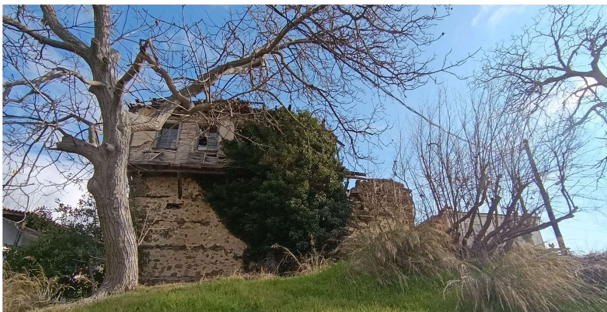
Φωτ. 4 Η όψη Δ του κτίσματος όπου διακρίνεται και το σαχινσί του ορόφου.