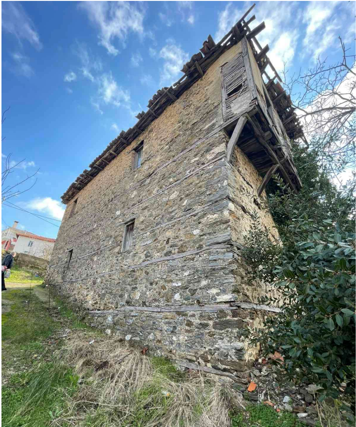
Φωτ. 5 Η όψη Γ του κτίσματος.