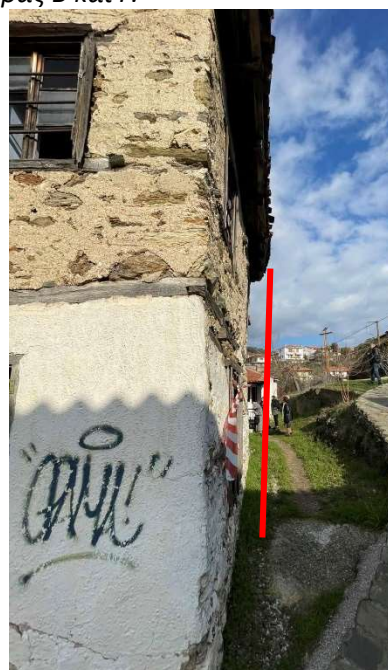
Φωτ. 8 Αριστερά βύθιση του παραθύρου του ισογείου από την πλευρά Α και Φωτ 9 Απόκλιση από την κατακόρυφο της πλευράς Β.