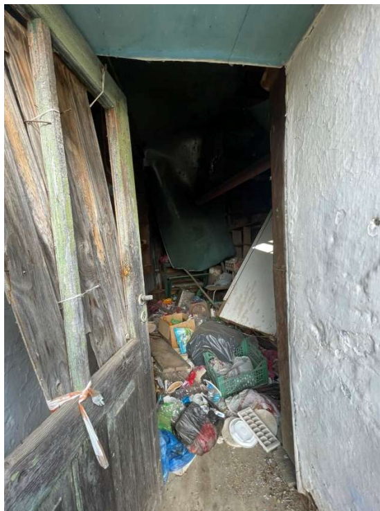
Φωτ. 12 και 13 Από το εσωτερικό του κτίσματος.