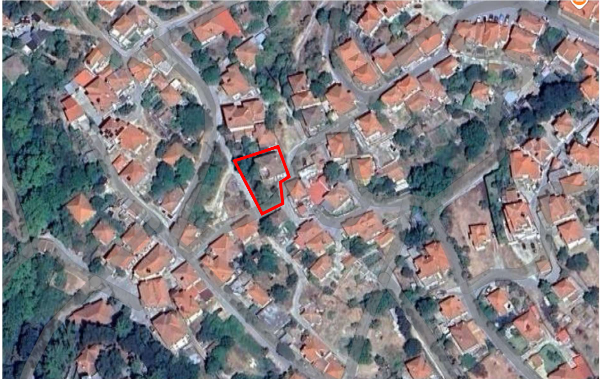
Φωτ. 1 Θέση του κτίσματος στον οικιστικό ιστό