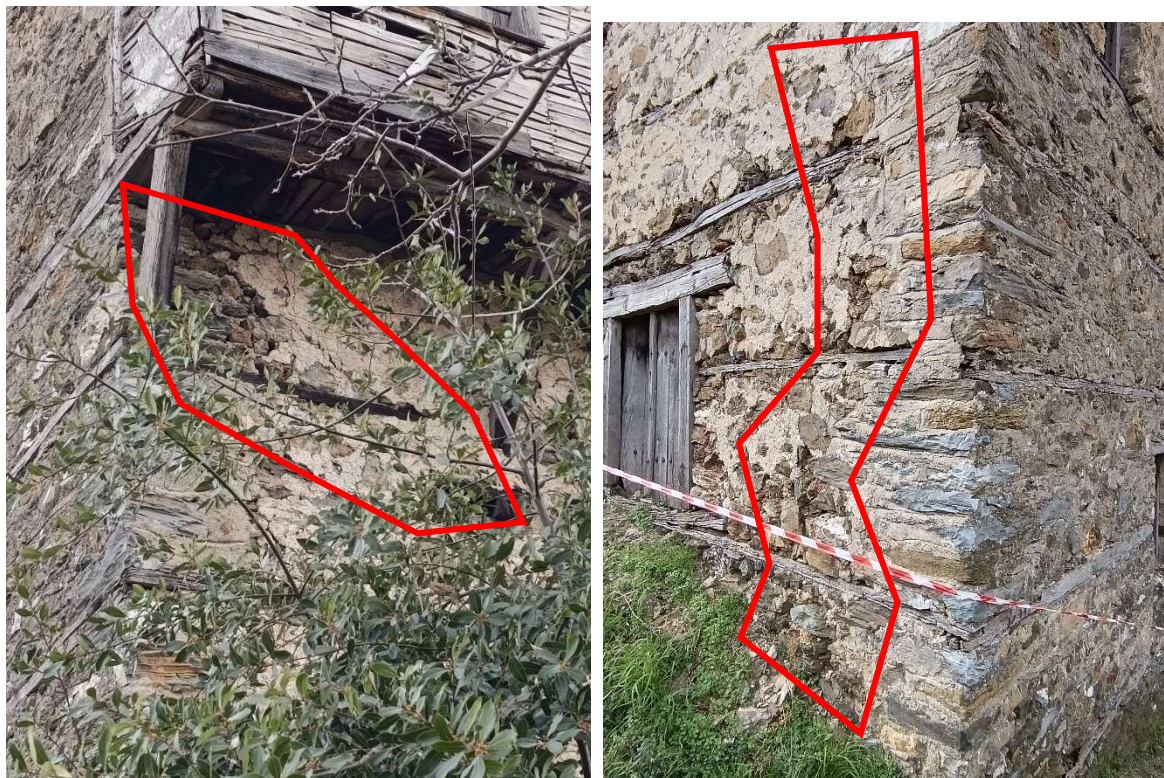
Φωτ. 6 Αριστερά Διαγώνια ρωγμή στην πλευρά Δ και Φωτ 7 Δεξιά ρωγμή δηλωτική αποσύνθεσης της γωνιακής σύνδεσης πλευράς Β και Γ.

πλευρών Β και Γ. Περαιτέρω η παθολογία του κτίσματος αφορά μικρή απόκλιση από την κατακόρυφο της προεξοχής της πλευράς Β ιδιαίτερα στο όροφο, βύθιση του παραθύρου του ισογείου στην πλευρά Α, αποδιοργάνωση επιχρισμάτων και υλικού δόμησης μαζί με απόκλιση από την οριζόντια του σαχνισιού. Ο τοίχος της πλευράς Γ είναι ο μόνος που δεν εμφανίζει ρηγματώσεις εφόσον κατά την μαρτυρία των ιδιοκτητών είχε επισκευαστεί (αναδομηθεί) σε απροσδιόριστο χρόνο στο παρελθόν. Αποδιοργάνωση και αποκόλληση λίθων εμφανίζει και ο λίθινος περίβολος του κτίσματος. Το εσωτερικό αλλά και ο περιβάλλον χώρος είναι γεμάτοι από μπάζα και απορρίμματα.