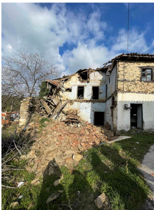
Φωτ. 10 Αριστερά Ο περίβολος του κτίσματος και Φωτ 11 Το τμήμα της πλευράς Α που έχει καταπέσει.