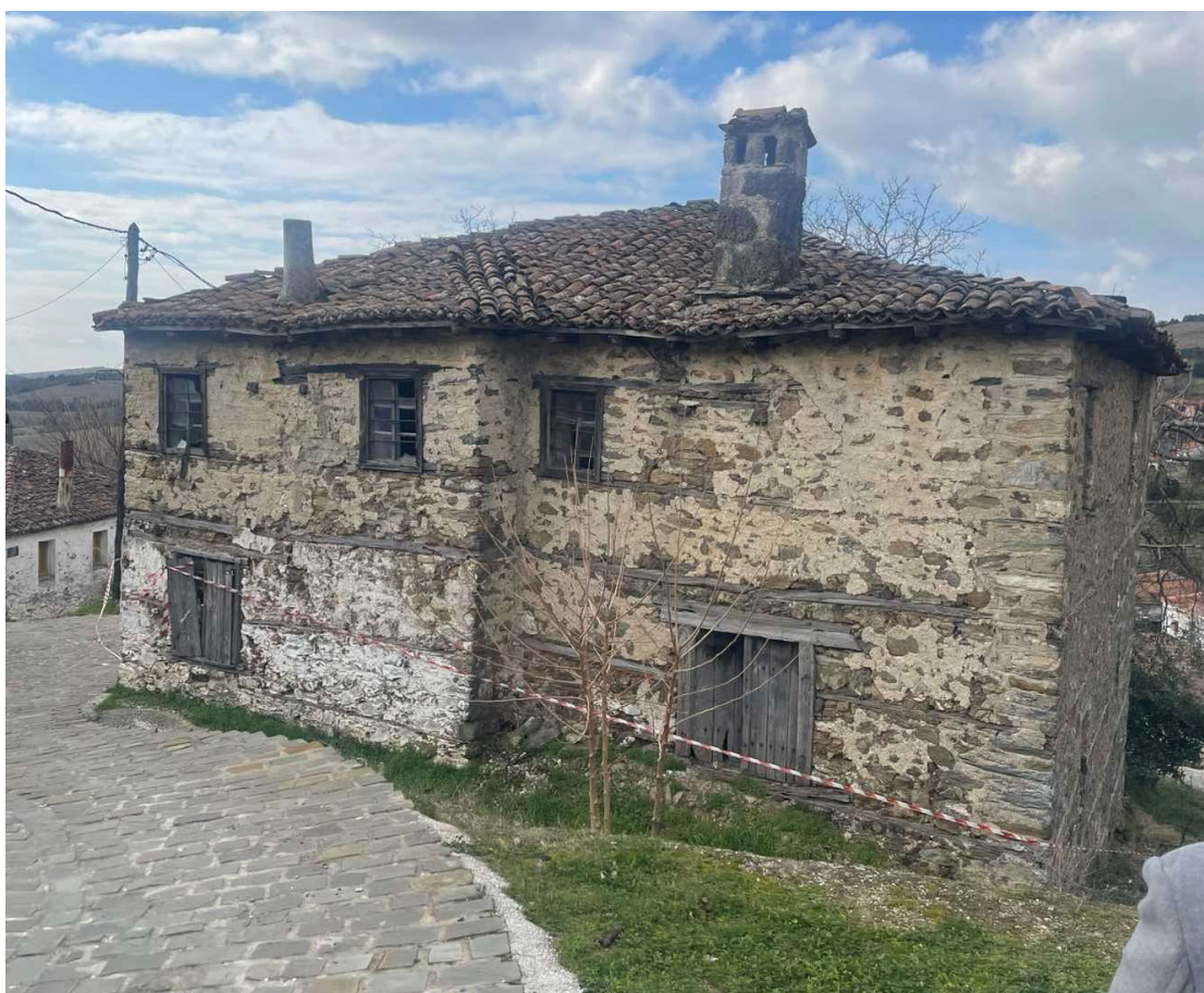
Φωτ. 2 Η όψη Β (βορειοανατολική)

Στις 28-01-2025 αρμόδια μηχανικός του Δήμου Πολυγύρου εκπόνησε αυτοψία – κατόπιν σχετικής καταγγελίας - και συνέταξε την υπ.αριθμ. 119/28-01-2025 έκθεση επικινδύνου κατασκευής. Σύμφωνα με την έκθεση αυτή το κτίσμα είναι εγκαταλειμμένο και παρουσιάζει σημαντικές φθορές εφόσον τμήμα του έχει ήδη καταπέσει. Κατόπιν τούτου ο Δήμος Πολυγύρου διαβίβασε, με το υπ.αριθμ.πρωτ. 13/29-01-2025 (119/28-01-2025) έγγραφό του, την υπόθεση και τα σχετικά έγγραφα στην Ε.ΕΠ.ΕΤ. Η αυτοψία διενεργείται κατόπιν της με αρ.πρωτ. 17/31-01-2025 πρόσκλησης (εντολής) διενέργειας αυτοψίας της Προέδρου της Επιτροπής.