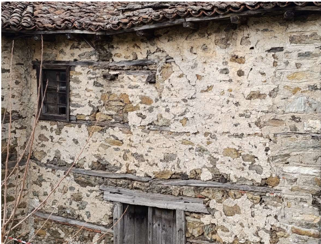
Φωτ. 14 Αποδιοργάνωση της τοιχοποιίας του ορόφου στην πλευρά Β.