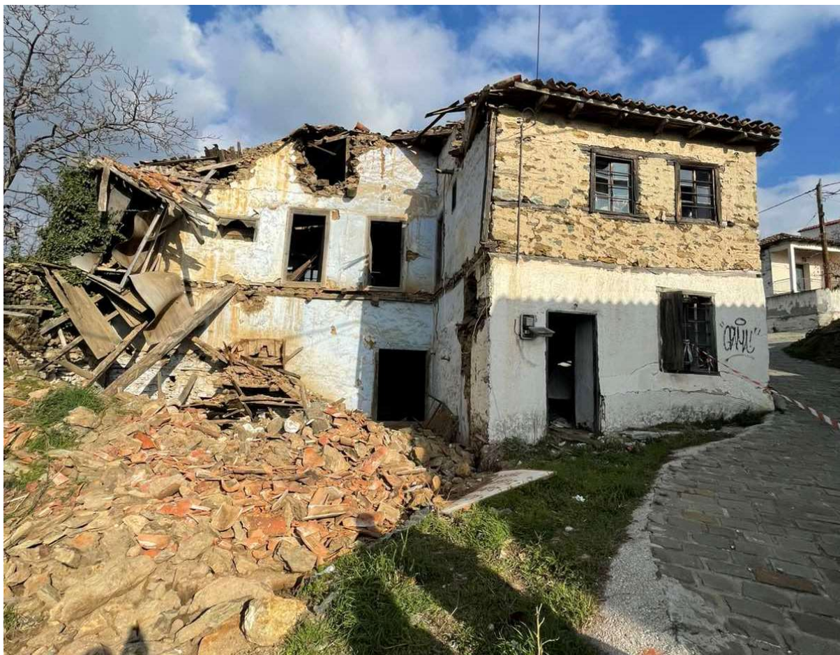
Φωτ. 3 Η όψη Α του κτίσματος όπου διακρίνεται και το τμήμα του στεγασμένου εξώστη το οποίο έχει καταπέσει.