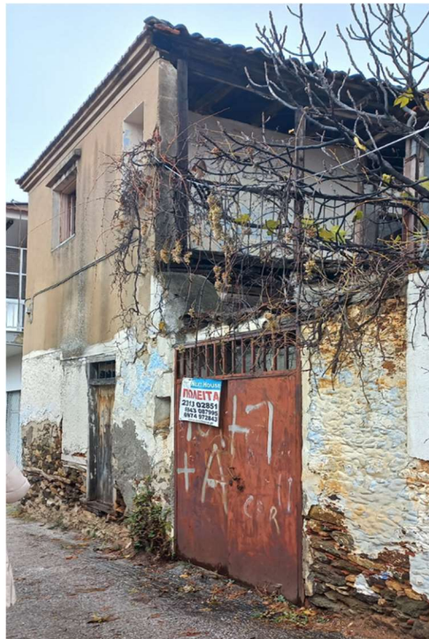
Φωτ. 2 Πρόσοψη του κτίσματος επί της κύριας οδού

Το κτίσμα είναι διώροφο με κάτοψη σχήματος Γ. Ο φέρων οργανισμός είναι από λιθοδομή στο ισόγειο και ξυλόπηκτους τοίχους στον όροφο και φέρει ξύλινη κεραμοσκεπή. Η κατασκευή πρέπει να έχει δεχθεί ποικίλες παρεμβάσεις κατά την διάρκεια της ζωής του με άνοιγμα – κλείσιμο ανοιγμάτων, επιχρίσματα από τσιμεντοκονίαμα σε κάποιες πλευρές και τμηματική αλλαγή της επικάλυψης της στέγης. Υπάρχει μικρή εσωτερική αυλή η οποία κατακλύζεται από άναρχες φυτεύσεις.