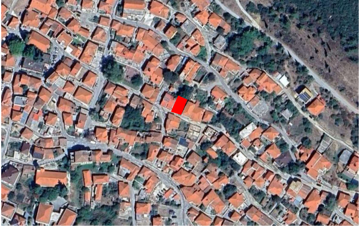
Φωτ. 1 Θέση του κτίσματος στον αστικό ιστό