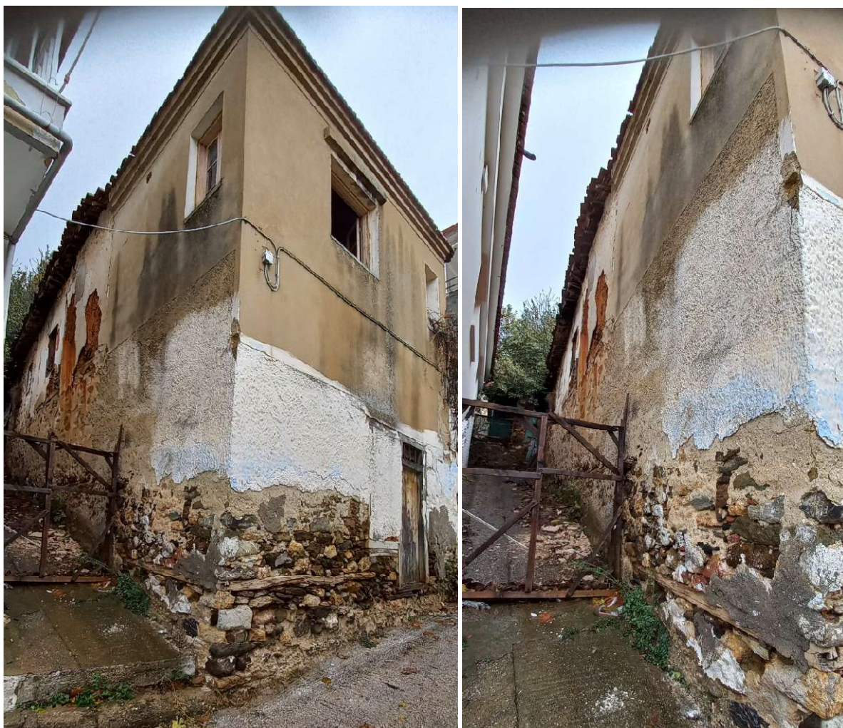
Φωτ. 3 & 4 Πλάγια όψη του κτίσματος

Στις 30-10-2024 αρμόδιος μηχανικός του Δήμου Πολυγύρου εκπόνησε αυτοψία και συνέταξε έκθεση επικινδύνου κατασκευής. Σύμφωνα με την έκθεση αυτό το κτίσμα είναι εγκατελειμμένο και έχει υποστεί πολυετή φθορά. Η στέγη παρουσιάζει παραμορφώσεις και αποκολλήσεις κεραμιδιών και η βορειοδυτική εξωτερική τοιχοποιία παρουσιάζει παραμόρφωση και αποσύνθεση μαζών. Κατόπιν τούτου ο Δήμος Πολυγύρου διαβίβασε, με το υπ.αριθμ.πρωτ. 2080/21103/30-10-2024 έγγραφό του, την υπόθεση και τα σχετικά έγγραφα στην Ε.ΕΠ.ΕΤ. Η αυτοψία διενεργείται κατόπιν της με αρ.πρωτ. 113/29-11-2024 πρόσκλησης (εντολής) διενέργειας αυτοψίας της Προέδρου της Επιτροπής.