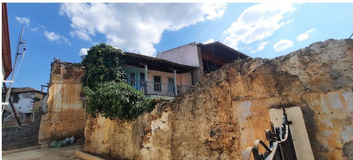
Φωτ. 4 Νοτιοδυτική πλευρά του κτίσματος

Το κτίσμα είναι εγκαταλειμμένο και σε μέτρια κατάσταση διατήρησης. Οι βλάβες που παρουσιάζει είναι συνοπτικά οι εξής: (α) βυθίσεις της στέγης που εντοπίζονται κυρίως στη βόρεια πλευρά, (β) πτώση επιχρισμάτων του λίθινου τοίχου του περιβόλου και έλλειψη στεφανώματος της λιθοδομής του ίδιου τοίχου, (γ) ρωγμή λόγω έλλειψης σύνδεσης δύο διαφορετικών τμημάτων τοίχου (λιθοδομής και πλινθοδομής) στην νότια πλευρά του περιβόλου, δίπλα από την ξύλινη θύρα, (δ) πτώση επιχρισμάτων, αιωρούμενα κεραμίδια, απώλεια υλικού δόμησης στη βάση των εξωτερικών τοίχων κατά μήκος της ακμής κατεδαφισθέντος τμήματος καθώς και διαγώνια μικρή ρωγμή στον τοίχο του ορόφου της ίδιας πλευράς, (ε) απώλεια υλικού αρμολόγησης της βόρειας λίθινης πλευράς, (στ) αποσάθρωση των ξύλινων στοιχείων που είχαν τοποθετηθεί ως προφυλακτικοί νάρθηκες στα ανοίγματα και την στέγη της βόρειας πλευράς.