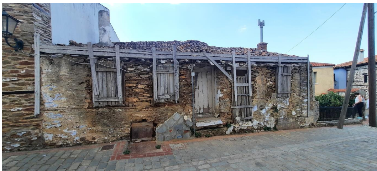
Φωτ. 3 Βόρεια όψη του κτίσματος