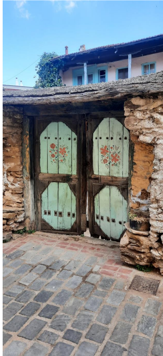
Φωτ. 8 Αριστερά το κτίσμα από τη νότια πλευρά και Φωτ 9 Δεξιά η εξωτερική ξύλινη αυλόθυρα