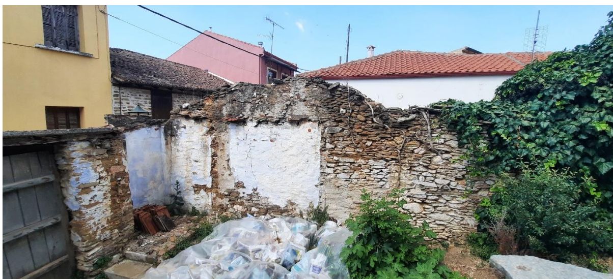
Φωτ. 7 Ο λίθινος περιβόλος από την πλευρά της εσωτερικής αυλής