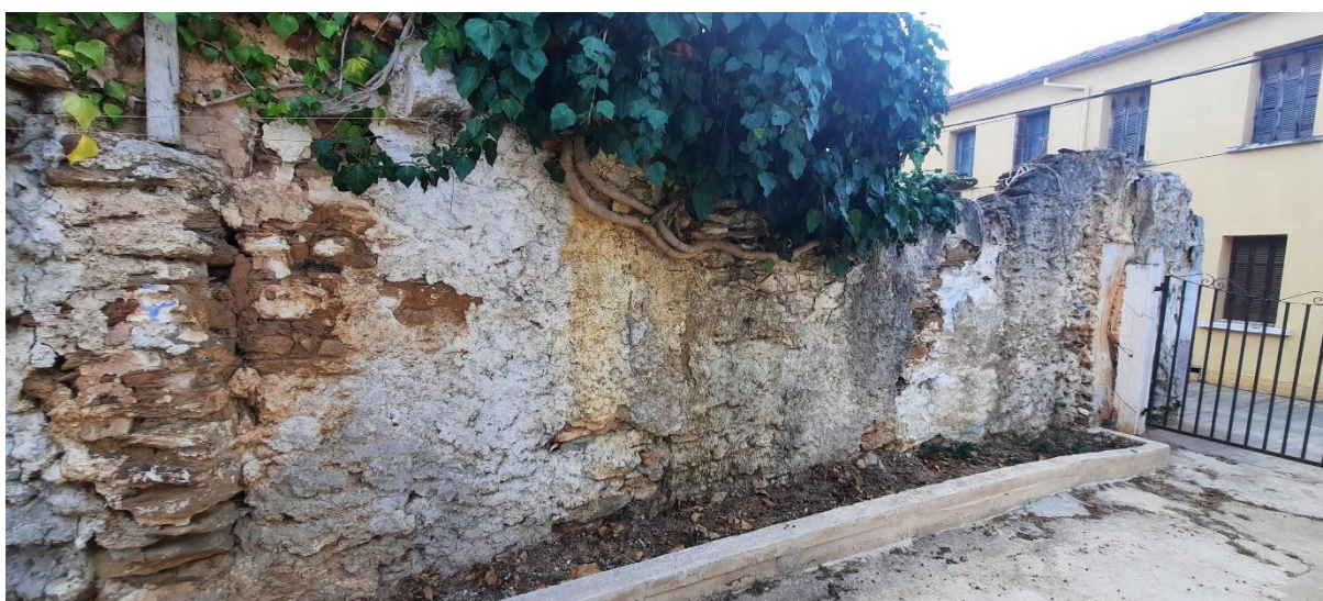
Φωτ. 6 Λεπτομέρεια του δυτικού μέρους του περιβόλου