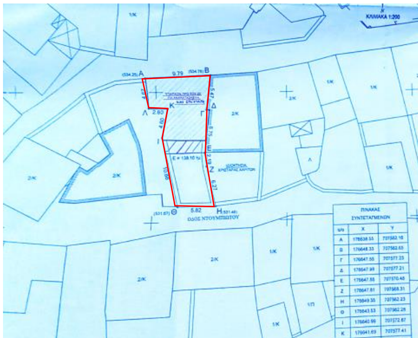
Φωτ. 2 Διάγραμμα της θέσης του κτίσματος