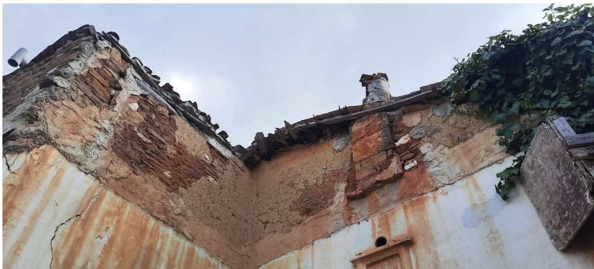
Φωτ. 5 Λεπτομέρεια του δυτικού τοίχου