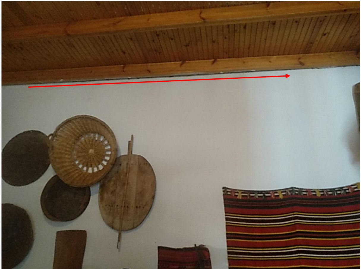
Φωτ.9 Λεπτομέρεια ψευδοδοκών στον όροφο του δυτικού τμήματος της νότιας πλευράς με ενδείξεις απόκλισης του διαχωριστικού τοίχου.