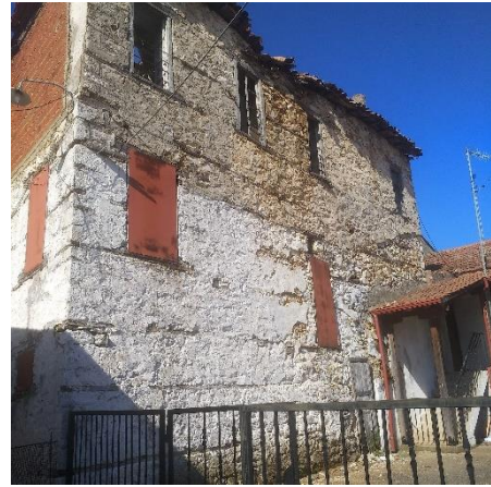
Φωτ.2 Αριστερά η νότια πλευρά του κτίσματος διαμοιρασμένη σε δύο τμήματα & 3 Δεξιά η βόρεια πλευρά του κτίσματος