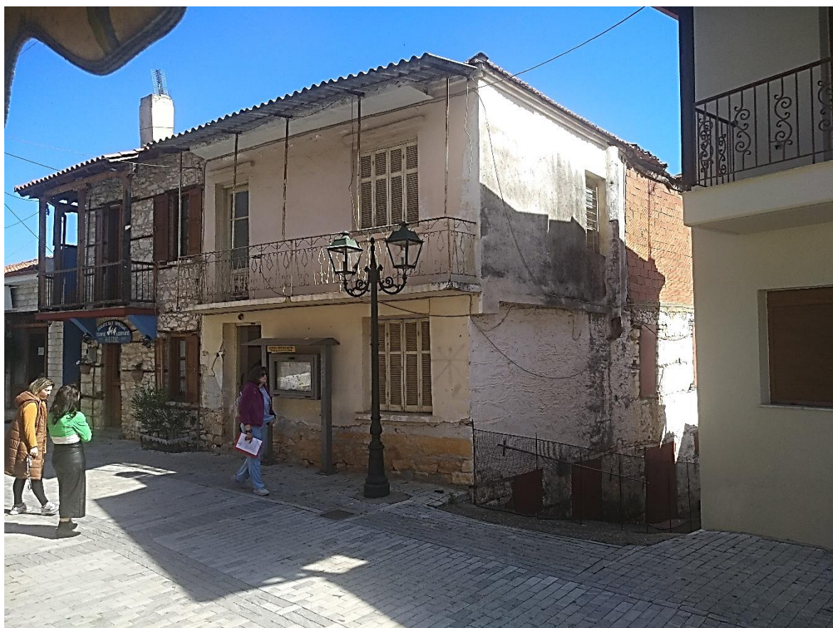
Φωτ.11 Το ανατολικό τμήμα της νότιας πλευράς