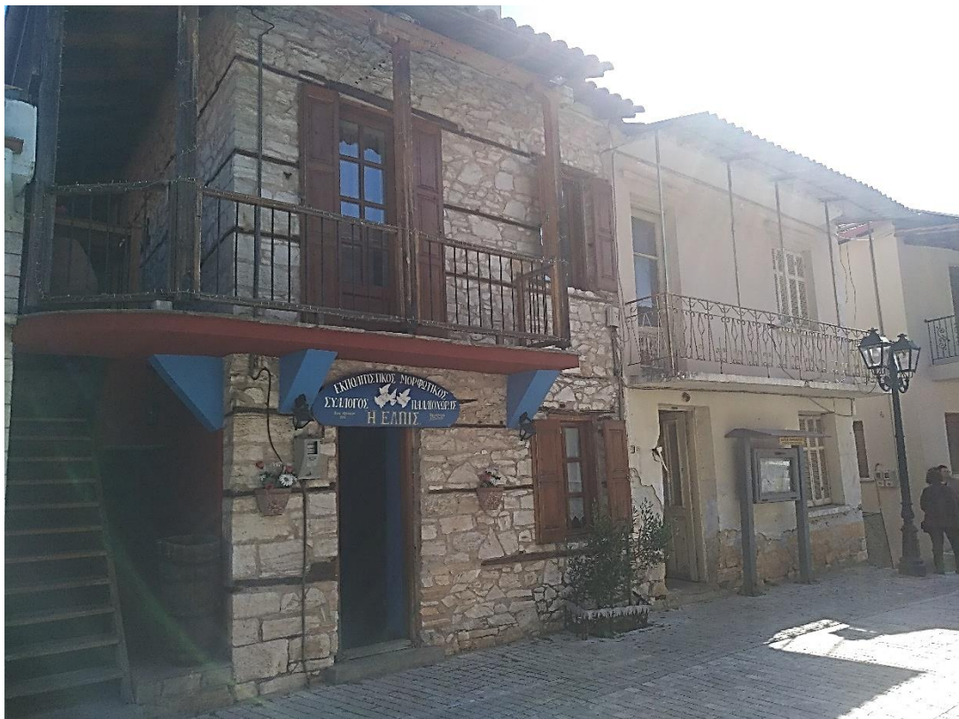
Φωτ.10 Το δυτικό τμήμα της νότιας πλευράς