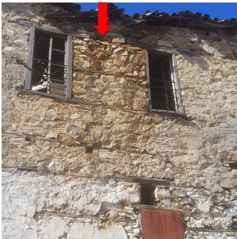
Φωτ.5 Λεπτομέρεια της βόρειας πλευράς όπου διακρίνονται έντονες ρηγματώσεις