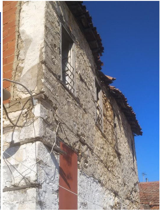
Φωτ.6 Λεπτομέρεια της βορειοδυτικής γωνίας. Αριστερά πάνω η προσθήκη σενάζ και η πλήρωση τοίχου με πλινθοδομή. Δεξιά πάνω η στρέβλωση της κατακόρυφωσης του τρίτου ορόφου. Κάτω απόκλιση του βόρειου τοίχου από την κατακόρυφο.