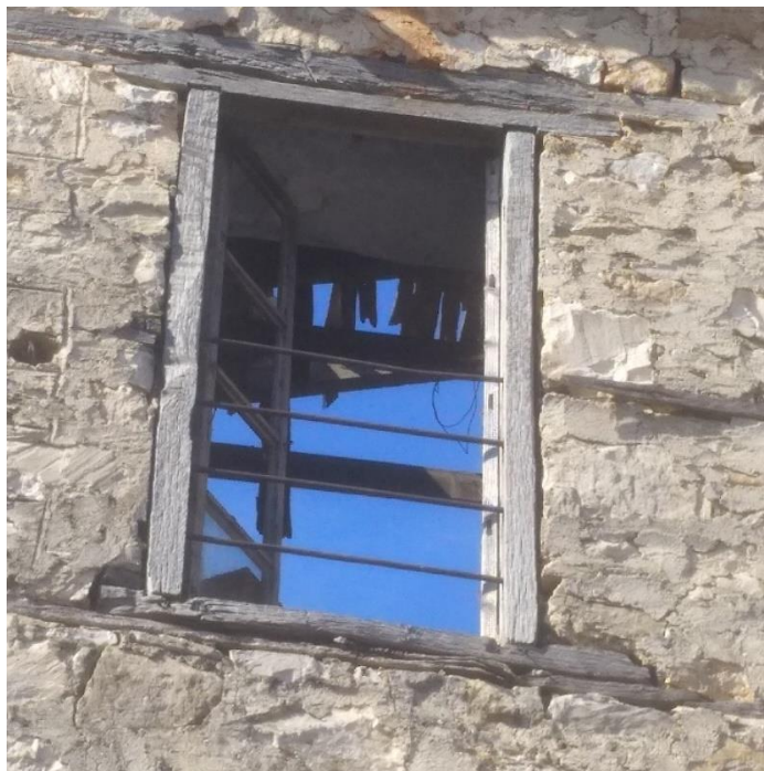
Φωτ.4 Λεπτομέρεια της βόρειας πλευράς όπου διακρίνεται η πτώση της στέγης

Το νότιο τμήμα από την δυτική πλευρά δεν εμφανίζει ιδιαίτερες βλάβες πέραν από μια παρατηρούμενη απόκλιση των ξύλινων ψευδοδοκών οροφής του ορόφου από τον κατακόρυφο τοίχο που διαμοιράζει την κατασκευή σε βόρειο και νότιο τμήμα στοιχείο που υποδηλώνει έλξη του εν λόγω τοίχου από την βόρεια πλευρά.