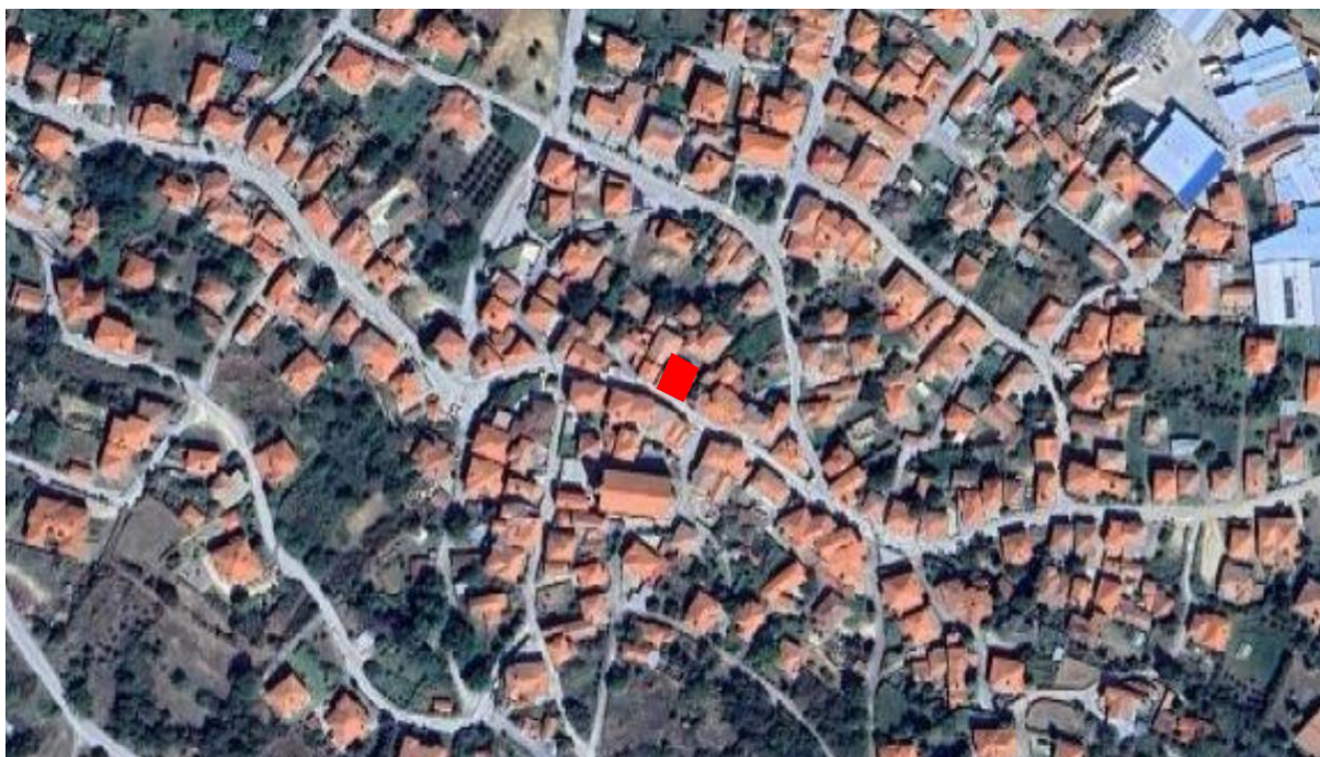
Φωτ. 1 Θέση του κτίσματος στον οικιστικό ιστό