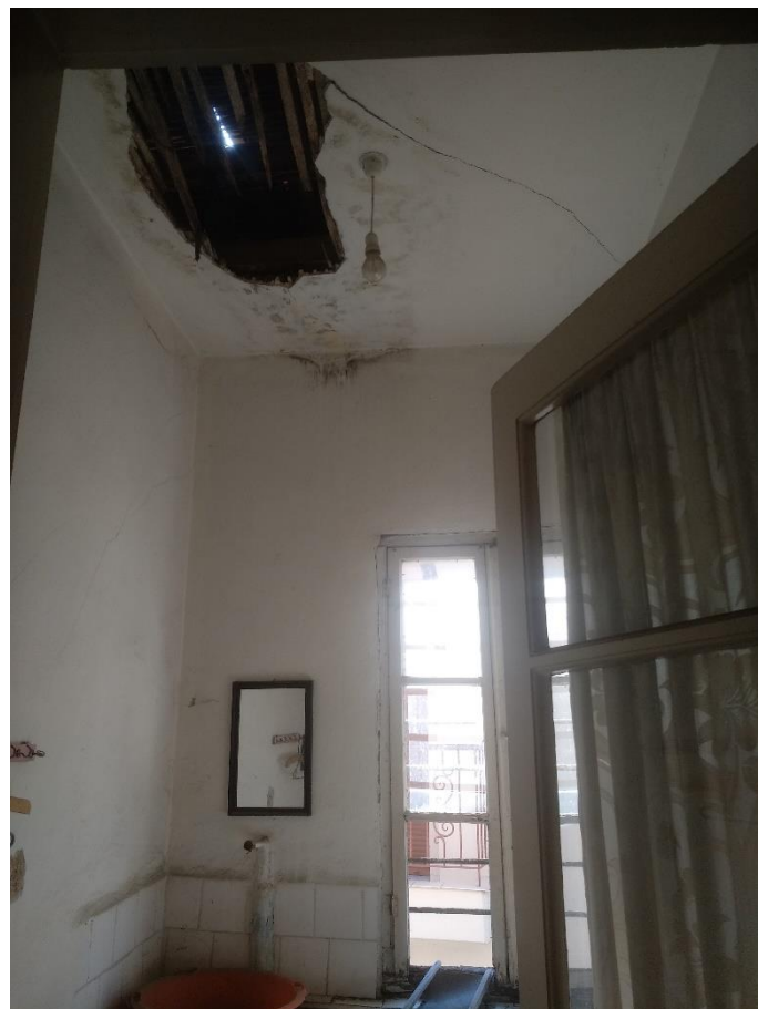
Φωτ.8 Λεπτομέρεια εσωτερικού από το δυτικό τμήμα της νότιας πλευράς όπου διακρίνεται πτώση ψευδοροφής και σπή στην στέγη