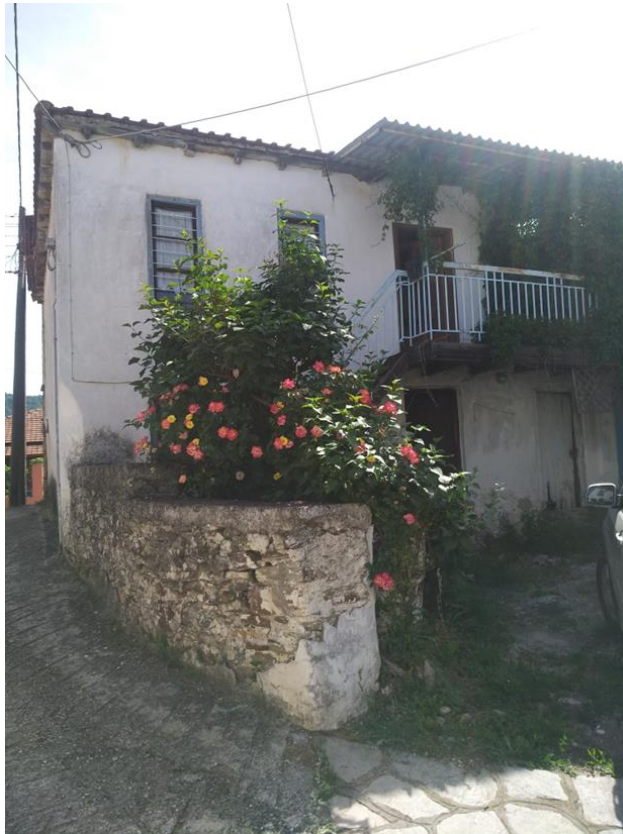
Φωτ. 2 Η όψη του κτίσματος από τη νότια πλευρά