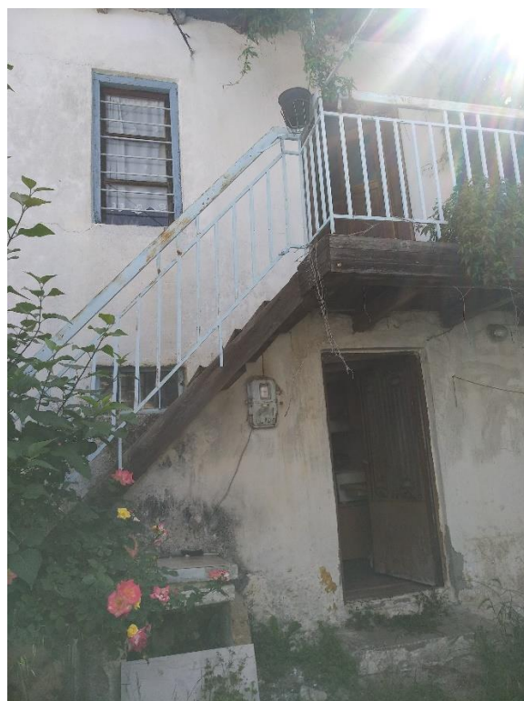
Φωτ. 7 (αριστερά) Καμπύλωση του δυτικού τοίχου Φωτ. 8 (δεξιά) η είσοδος ισογείου και ορόφου από τη νότια πλευρά.