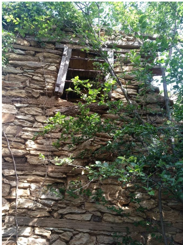
Φωτ. 5 (αριστερά) Το οικοδομικό υλικό της κατάρρευσης και Φωτ. 6 (δεξιά) υπόλειμμα τοίχου ανατολικής πλευράς.