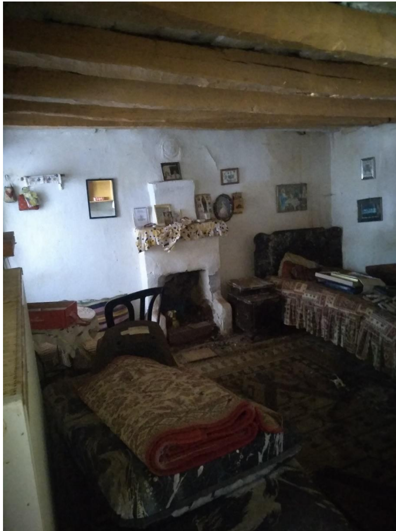
Φωτ.9 Καμπυλώσεις των ξύλινων δοκών υποδομής των δαπέδων στο εσωτερικό.