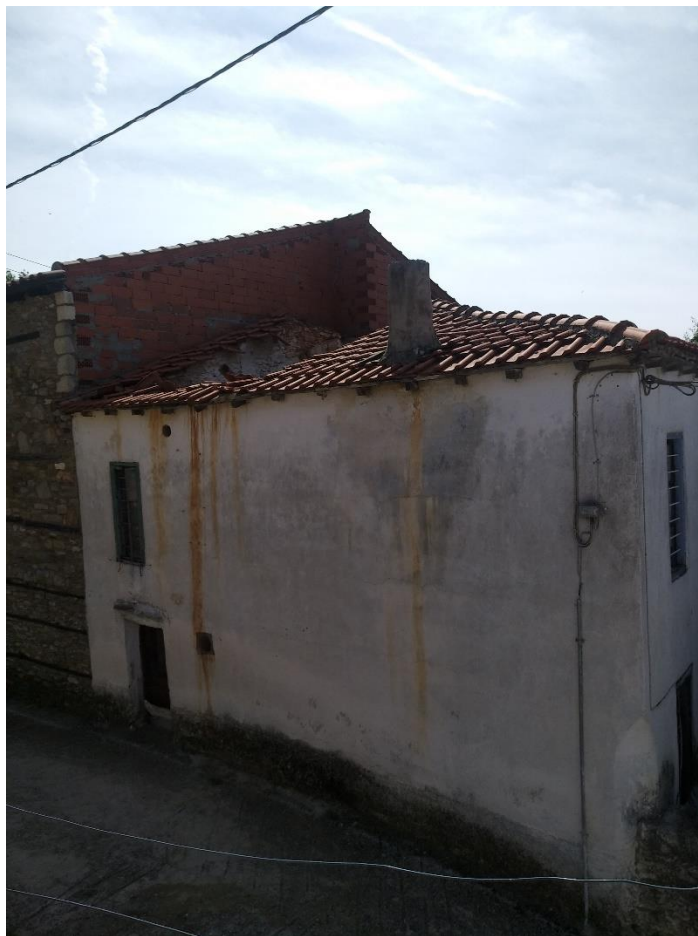
Φωτ. 3 Η όψη του κτίσματος από τη δυτική πλευρά όπου διακρίνεται η κατάρρευση της στέγης.