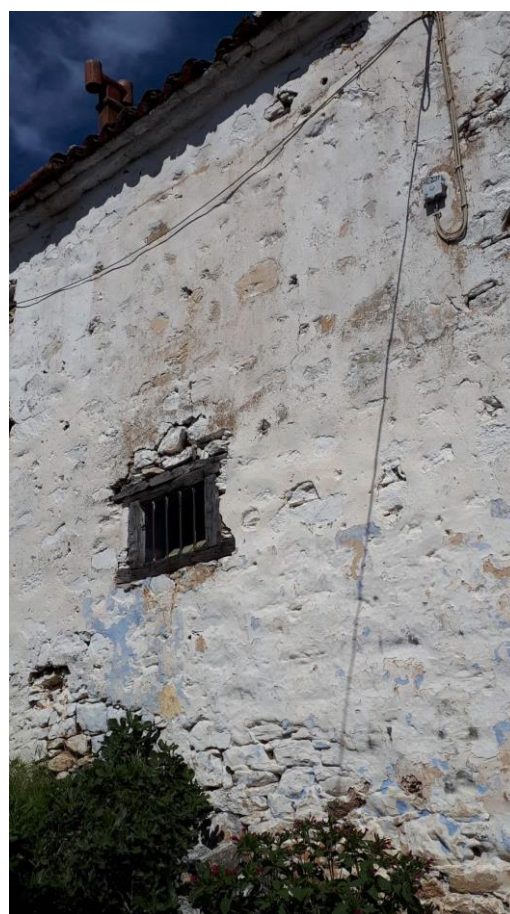
Φωτ. 2 Νότια όψη του κτίσματος και Φωτ. 3 Ανατολικός τοίχος του κτίσματος