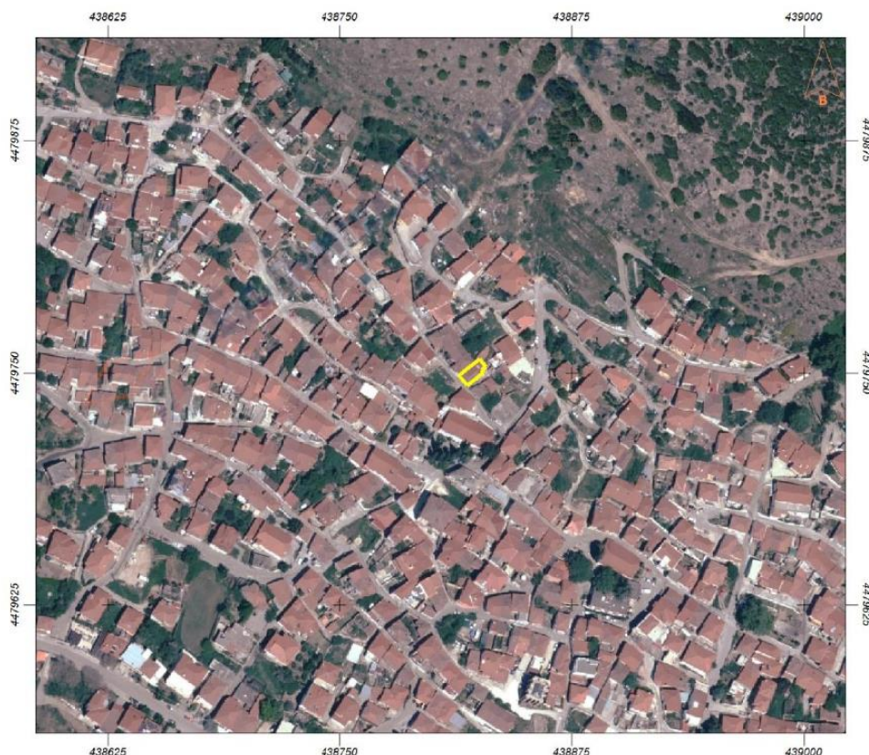
Φωτ. 1 Θέση του κτίσματος στον οικιστικό ιστό