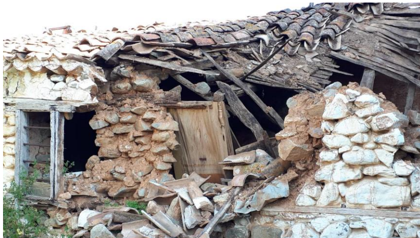
Φωτ. 3 Το ανατολικό τμήμα που έχει καταρρεύσει

Το κτίσμα είναι εγκαταλειμμένο και σε πολύ κακή κατάσταση διατήρησης. Το δυτικό τμήμα της στέγης καθώς και ο νότιος τοίχος έχουν καταρρεύσει και τα οικοδομικά μπάζα βρίσκονται εντός του κτίσματος. Ο δυτικός τοίχος (που εφάπτεται του σημείου κατάρρευσης) είναι ουσιαστικά μεσοτοιχία με το κτίσμα κατοικίας της γειτονικής ιδιοκτησίας και φέρει κάποιες βλάβες που προκλήθηκαν από την κατάρρευση. Όλη η υπόλοιπη κατασκευή βρίσκεται επίσης υπό διαδικασία κατάρρευσης. Τέλος το κτίσμα είναι επικίνδυνο και από υγειονομικούς όρους λόγω των μάζων και των άλλων απορρίψεων που βρίσκονται συγκεντρωμένα στο εσωτερικό του.