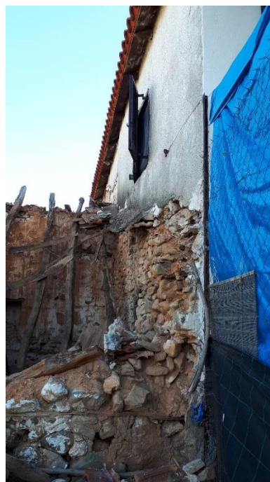
Φωτ. 4 Αριστερά εσωτερικό της κατασκευής και Φωτ. 5 Δεξιά η μεσοτοιχία με το γειτονικό κτίσμα