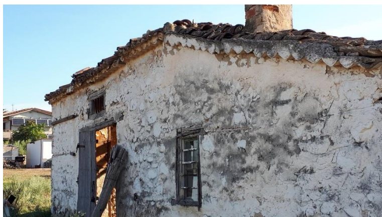
Φωτ. 2 Δυτική πρόσοψη του κτίσματος

Πρόκειται για ισόγεια κατασκευή που αποτελεί το δυτικό τμήμα ενός μεγαλύτερου κτίσματος που έχει διαιρεθεί σε απροσδιόριστο χρόνο στο παρελθόν. Σε τμήμα του ανατολικού μέρους υπάρχει ο όροφος κατοικίας (άλλης ιδιοκτησίας) οπότε και το εξεταζόμενο τμήμα εφάπτεται στην δυτική πλευρά αυτού του δώροφου ανατολικού τμήματος. Το κτίσμα είναι κατασκευασμένο από λιθοδομή και συνδεδετικό αργιλοκονίαμα ενώ ξύλινα υποστυλώματα έφεραν την ξύλινη στέγη που επικαλύπτεται με βυζαντινά κεραμίδια. Τα ανοίγματα είναι και αυτά ξύλινα.