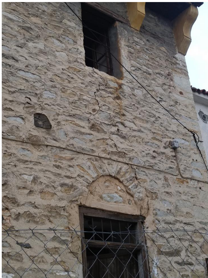
Φωτ.4 Διαμπερή ρωγμή στο υπέρθυρο του ισογείου της νότιας όψης