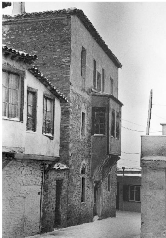
Φωτ.3 Βορειοδυτική όψη του κτίσματος το 1984 από δημοσιευμένη φοιτητική μελέτη