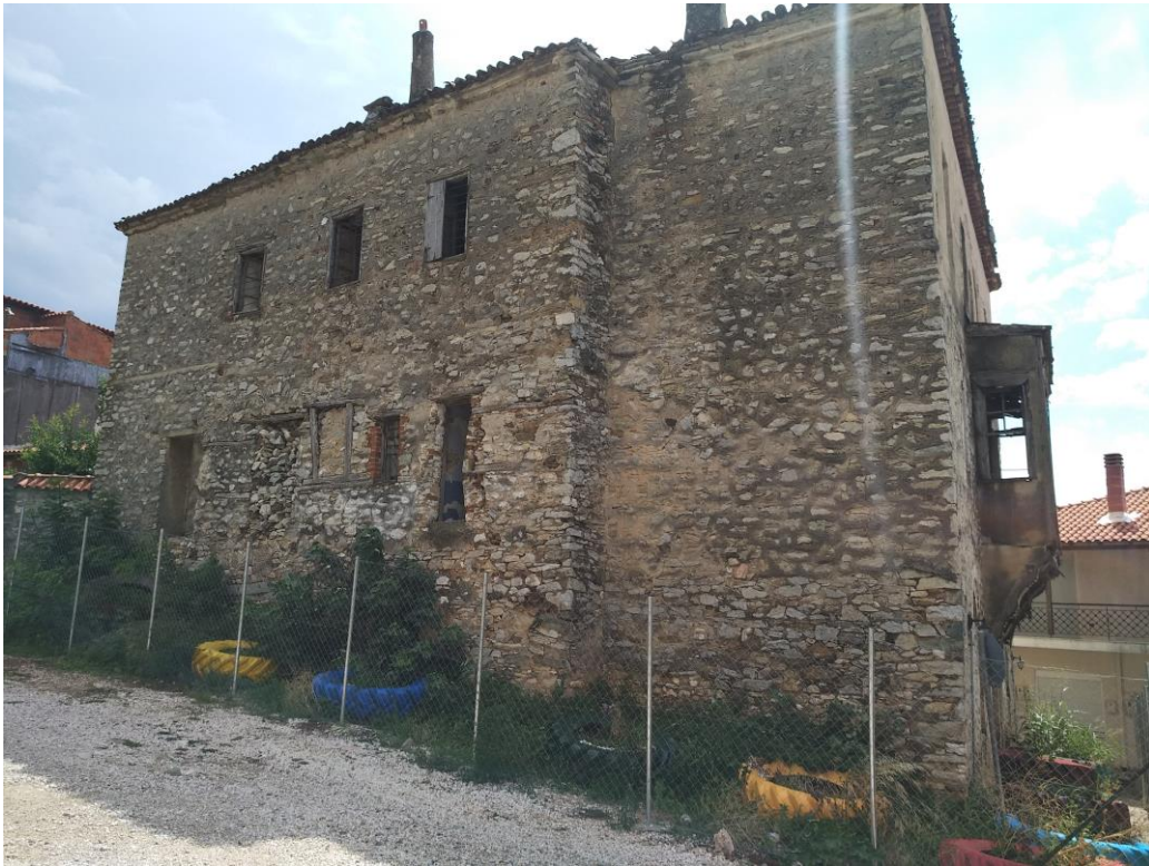
Φωτ.2 Βορειοδυτική όψη του κτίσματος