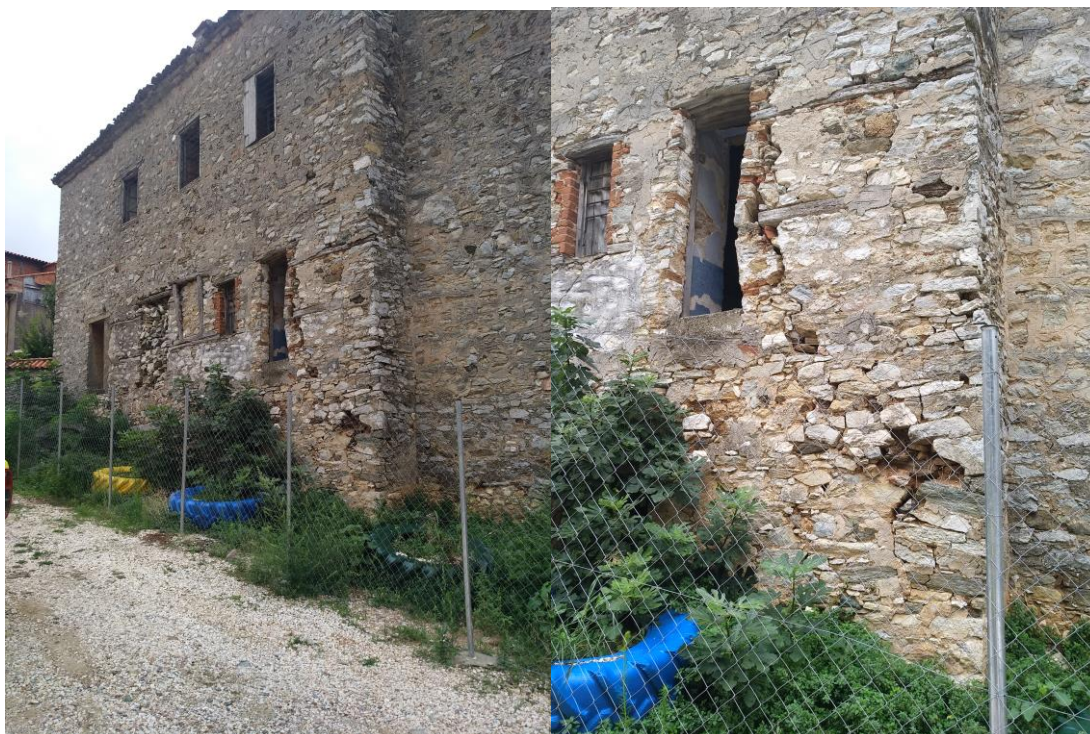
Φωτ.9 και 10 Διαμπερείς ρωγμές και αποκόλληση προεξοχής στην βόρεια όψη