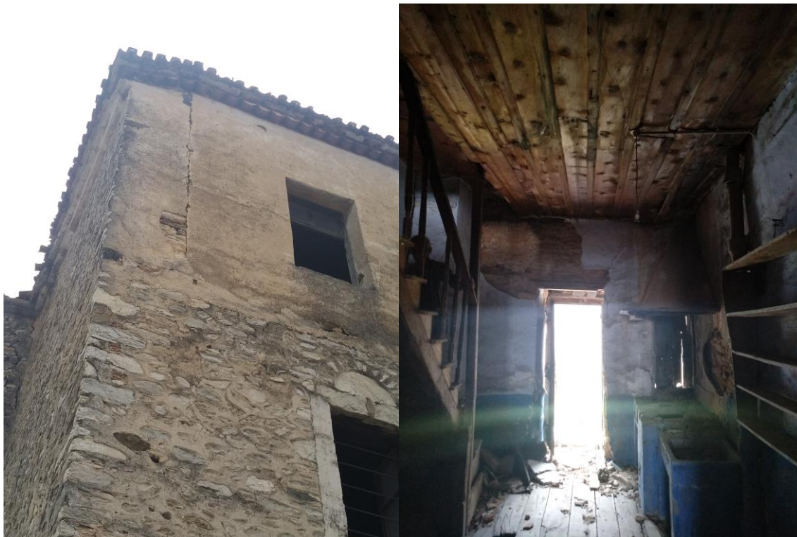
Φωτ.7 Ρωγμή αποκόλλησης βορεινού με δυτικό τοίχο 3ου ορόφου και Φωτ. 8 Εσωτερική όψη με μπάζα, αποκολλήσεις επιχρισμάτων - κονιαμάτων και βλάβες στις ξύλινες ψευδοροφές.