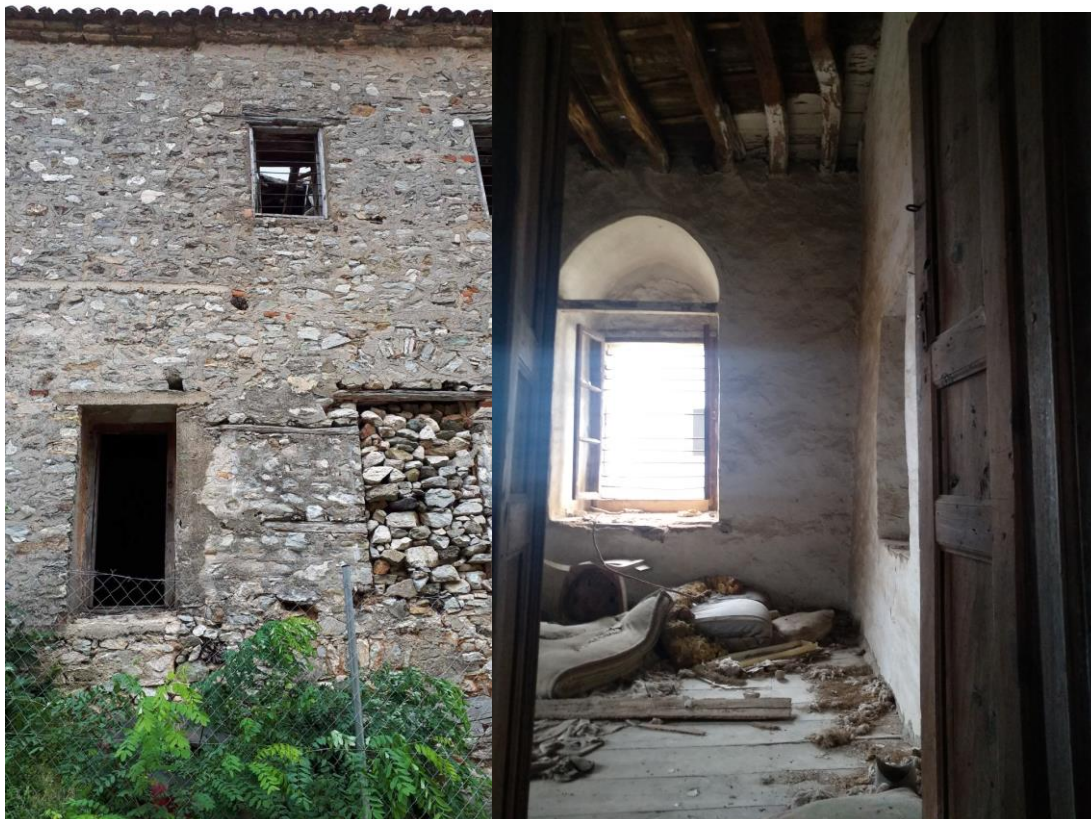
Φωτ.10 Κατάπτωση της στέγης όπως διαφαίνεται από παράθυρο της βόρειας όψης και Φωτ. 11 εσωτερικό 1ου ορόφου