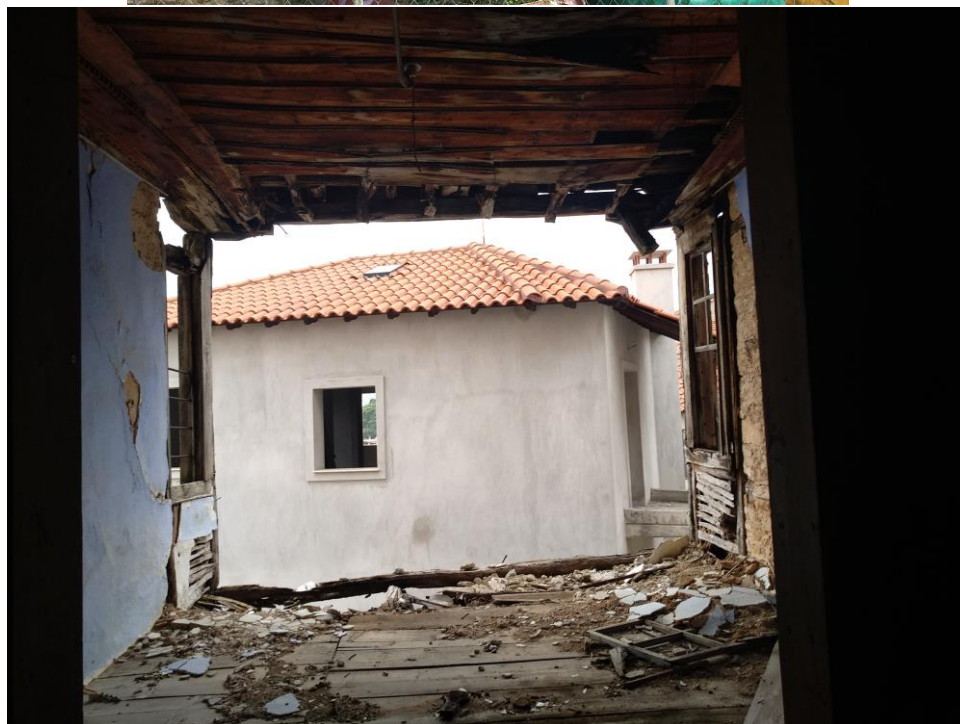
Φωτ.5 και 6 Εξωτερική και εσωτερική όψη του κατεστραμμένου εξωτερικού τοίχου του σαχνισιού της δυτικής όψης